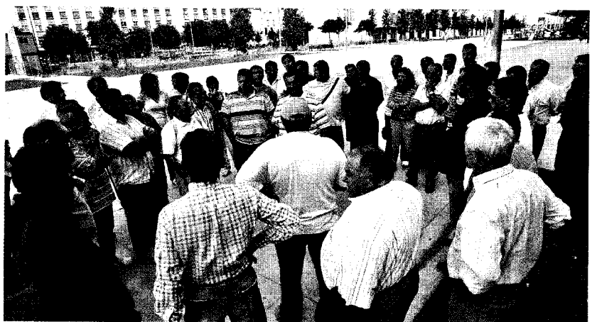
Los feriantes que venían habitualmente a San Fermín se concentraron junto al parque de la Runa.

● "DESÁNIMO GENERALIZADO" Los feriantes que habitualmente venían a Pamplona por San Fermín, un total de 84, comenzaron ayer una serie de concentraciones en el bulvar de Aneliet, cerca del recinto ferial del parque de la Runa, actos de protesta que están realizando mañana y tarde. "Hay un gran desánimo entre los feriantes, porque 84 familias se han quedado sin trabajo", reconoció el presidente de la asociación de feriantes, y añadió que "el Ayuntamiento ha mostrado