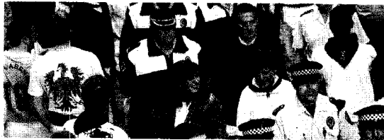
Agentes de la Policía Municipal, con varios concejales en 2007.